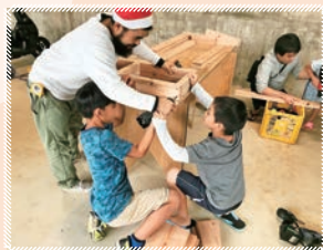
テーブル作り。子供たち大活躍!