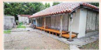
ウッドデッキ完成!