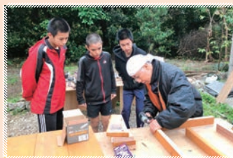
真剣にレクチャーを受けてます。