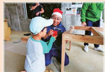
将来は大工さんかな?