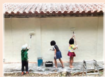
外壁をペンキで綺麗にしました。