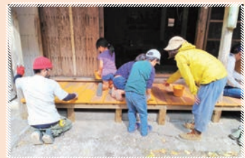
みんなでウッドデッキを作りました!