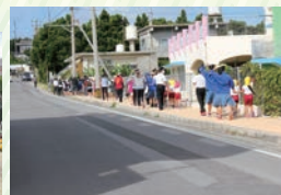
東ふれあいセンターへ避難