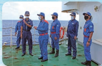
船長より説明を受ける一行