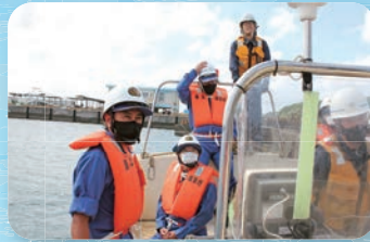
警備救難艇にて沖合の巡視船へ