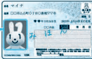
< おもて面 >