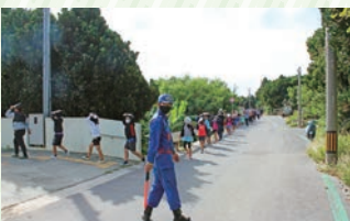
歩道が無いので消防団員が誘導