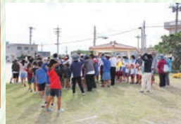
落ち着いて中庭に集合