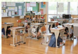
地震発生！机に隠れる！