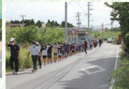
「おかしもち」を忘れずに