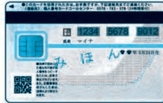
< うら面 >

うら面のICチップに あなた本人である ことを証明する、 「電子証明書」 が入っているよ!