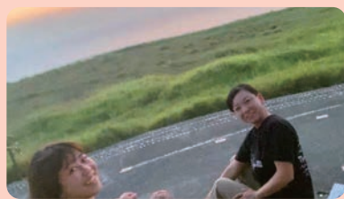
マハナ展望台で夕涼み