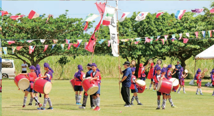
粟国村 粟国大運動会（詳細は2頁）