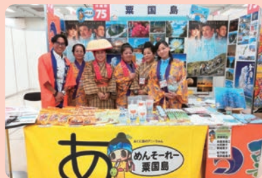
思い出のアイランダー 2018