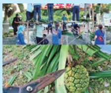
運動会前のソテツ門

づくりで中央に飾るアダンの実の葉っぱをカットさせていただきました！切り具合がわからず後から切り直しされていましたが、みんなで作るソテツ門づくりは子どもたちへの温かな思いを感じました。