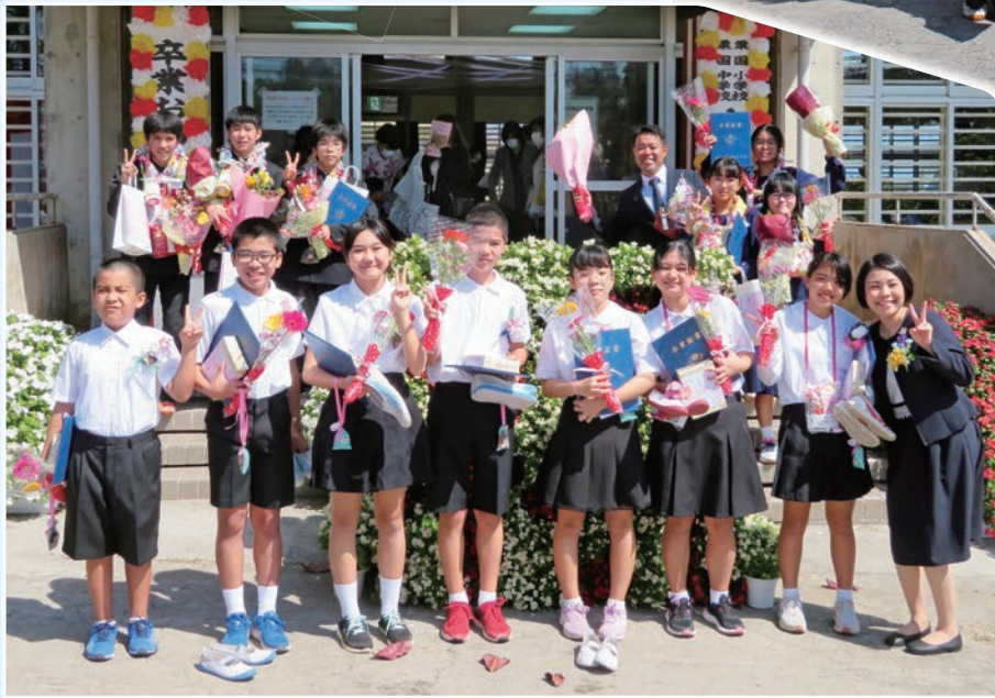
栗国村小中学校卒業式