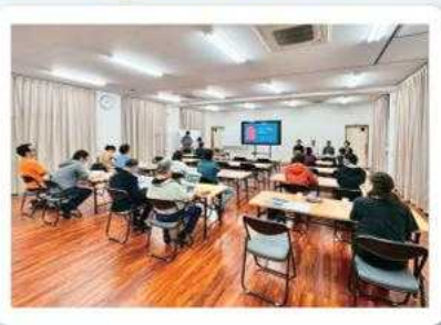
栗国村地域おこし協力隊 一同

お忙しい中にもかかわらず、たくさんの方がお足運びいただきましたことを深く御礼申し上げます。ありがとうございました。