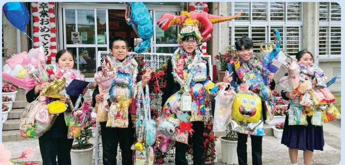
栗国小中学校卒業式