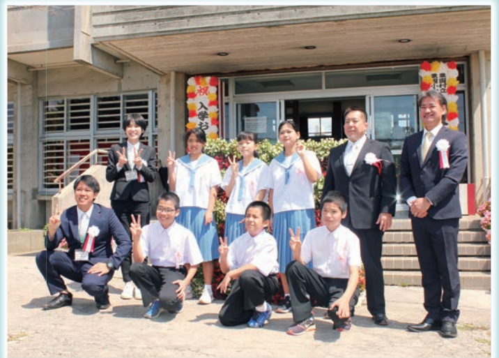
粟国小中学校入学式及び粟国幼稚園入園式（詳細は10頁）