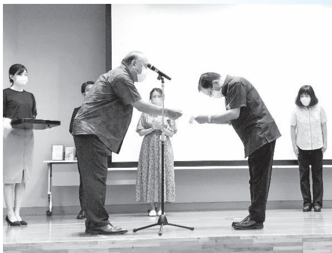
<受賞する高良村長>