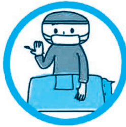
▶ 不妊手術をし Neuter