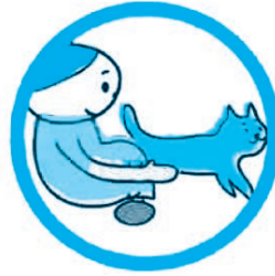
▶ 元の場所に戻す Return