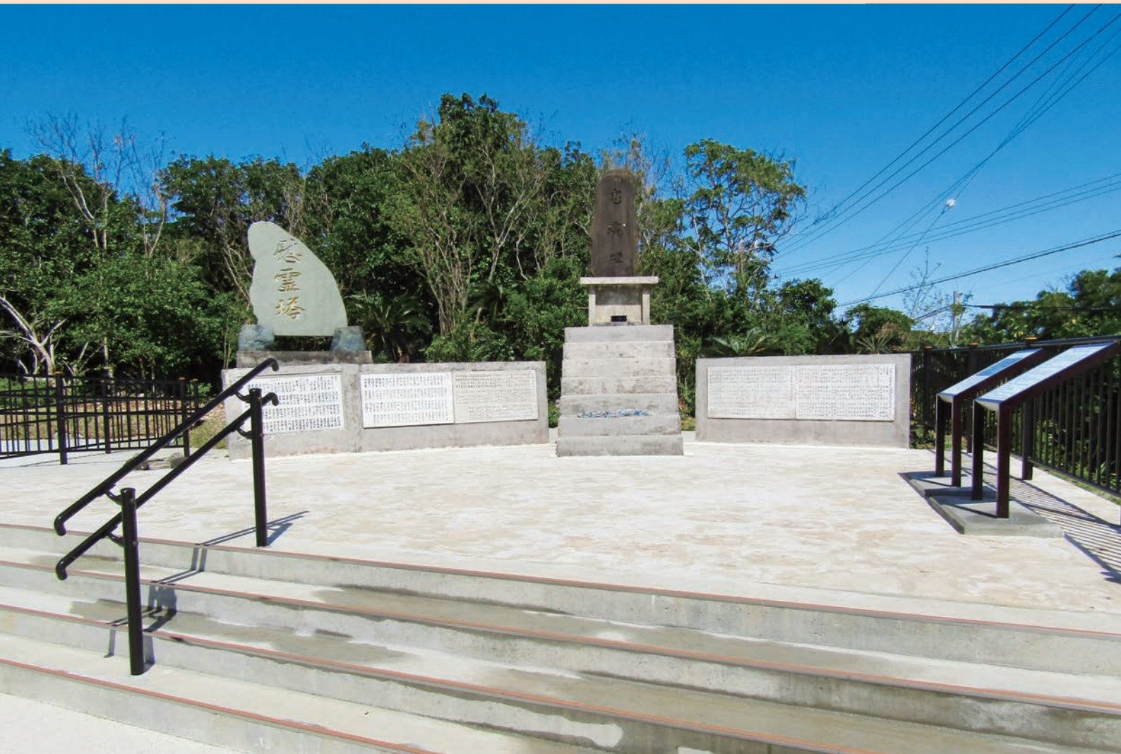
一括交付金を活用し慰霊碑の整備工事を行いました