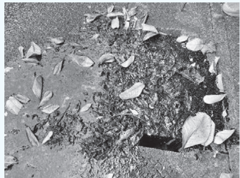
廃油の不法投棄 令和4年5月2日

不法投棄をした者は、5年以下の懲役若しくは、1,000万円以下の罰金又はその両方が課せられます。