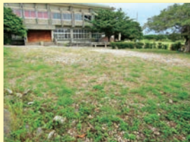
【新設公園(体育館前)】