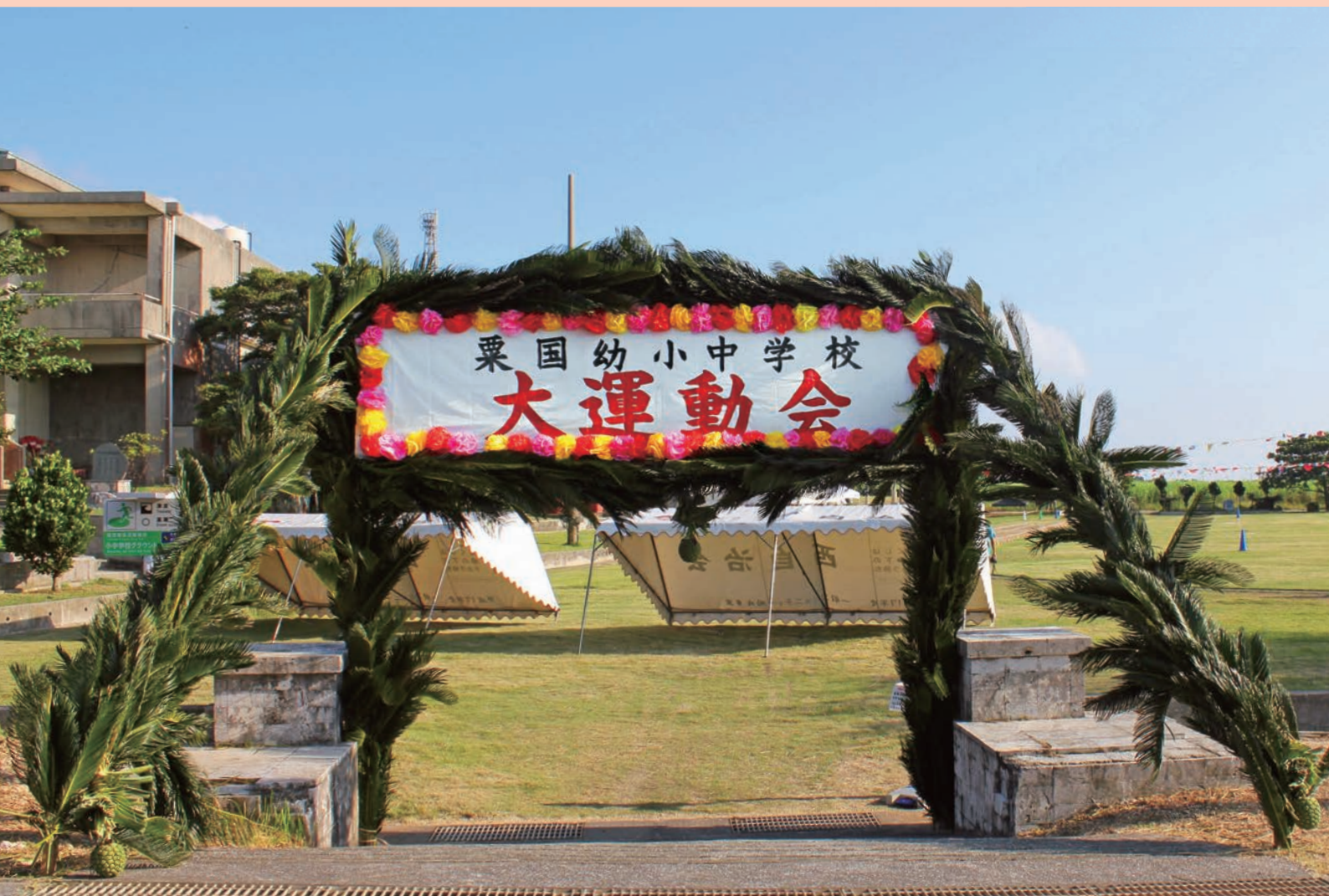
粟国幼小中学校大運動会（詳細は13頁）