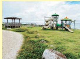
【改修公園(ヘビ公園)】