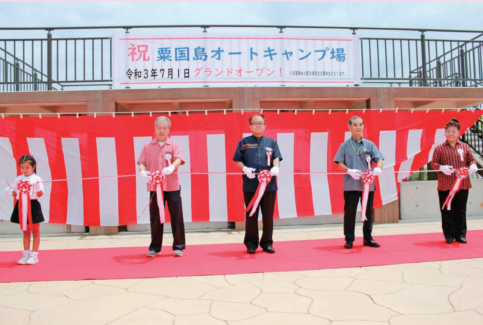
粟国島オートキャンプ場 オープン記念式典