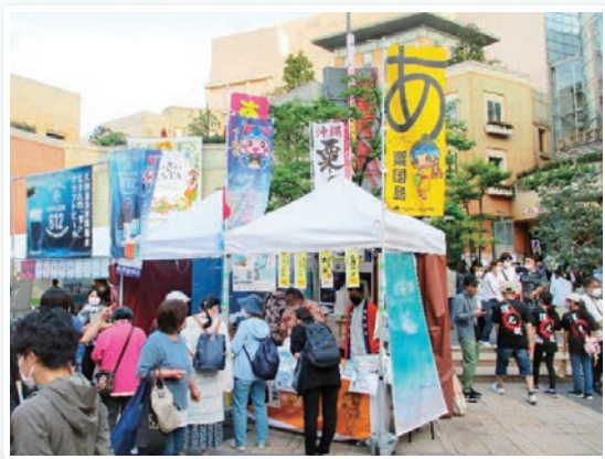
— 賑わうブースの様子 —