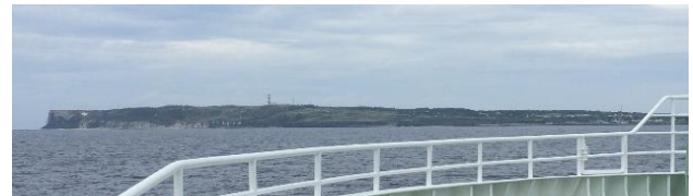
海(航路)からの眺望