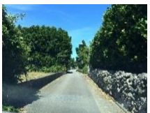
石垣とフクギ並木