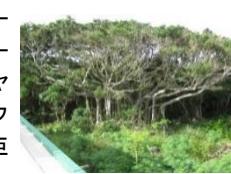
観光協会裏のガジュマル