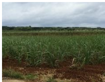
さとうきび畑等の広い農地