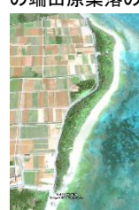
モンパの群落（ウーグ浜、マハナ海岸など）