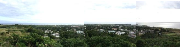
大正池公園の展望台