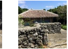
ナビィの家 (A家住宅)