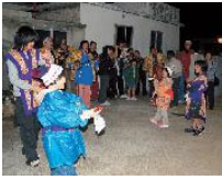
マースヤー (大晦日 12月30日)