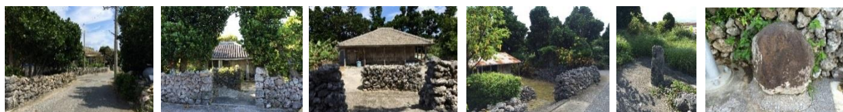
石垣とフクギ並木