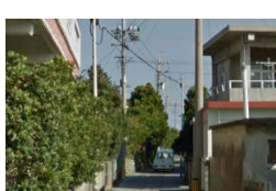
浜売店の西側にあるフクギ並木（浜区のナカガーから南へのフクギ並木等）