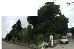
浜区のシンボルツリー（フクギの巨木・老木）（トゥマンジ ヨーウフヤーの福木巨木）