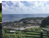
毛平原遺物散布地 村指定名勝「坂木那 原海岸景勝の地」