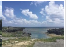
ボージャリーノウ