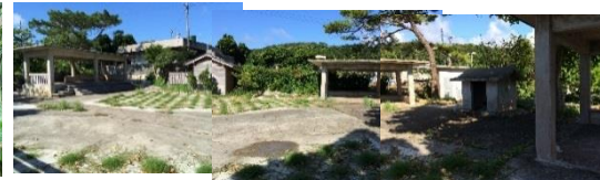
イビガナシー(八重大中)