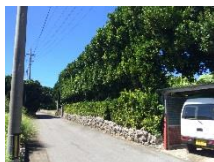
石垣とフクギ並木