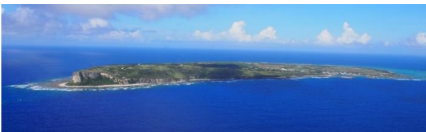
空(航空路)からの眺望