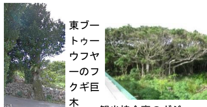
東ブー トウ ウフヤ ーのフ クギ巨 木