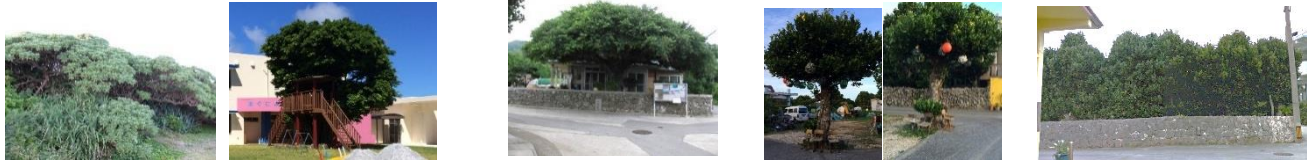
貴重な樹木・草花