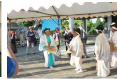
ヤガンウユミ (6月26日)